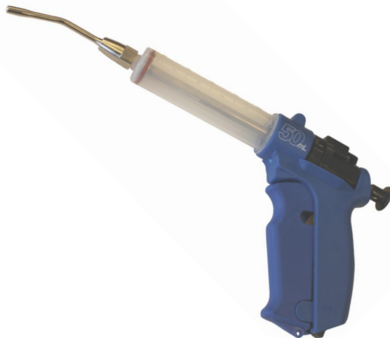
Phillips halvautomatisk doseringsprøyte i hardplast, med sylinder i polypropylen og munnstykke i metall.

Ergonomisk grep reduserer belastningen på hånda.