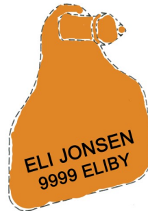
Combi 3000 Mini tappdel, med innsidepreging