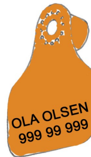
Combi 3000 Mini hullidel, med innsidepreging