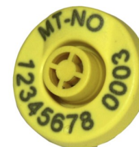
Combi E30 ®

Combi E30 ® skal settes på med Combi Junior tang. Både påsetting og bruk er dyrevennlig. Lukket merkespiss hindrer smitteoverføring, og sårflata gror raskt.