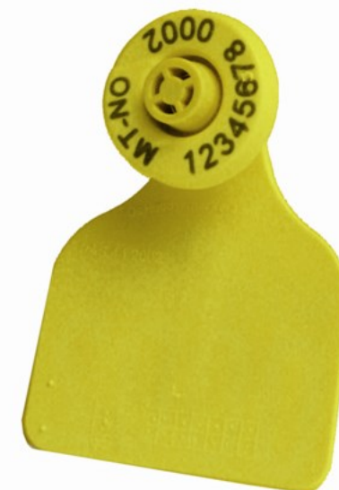
Combi E30 ® hulldel med Combi 2000 ® Stor tappdel